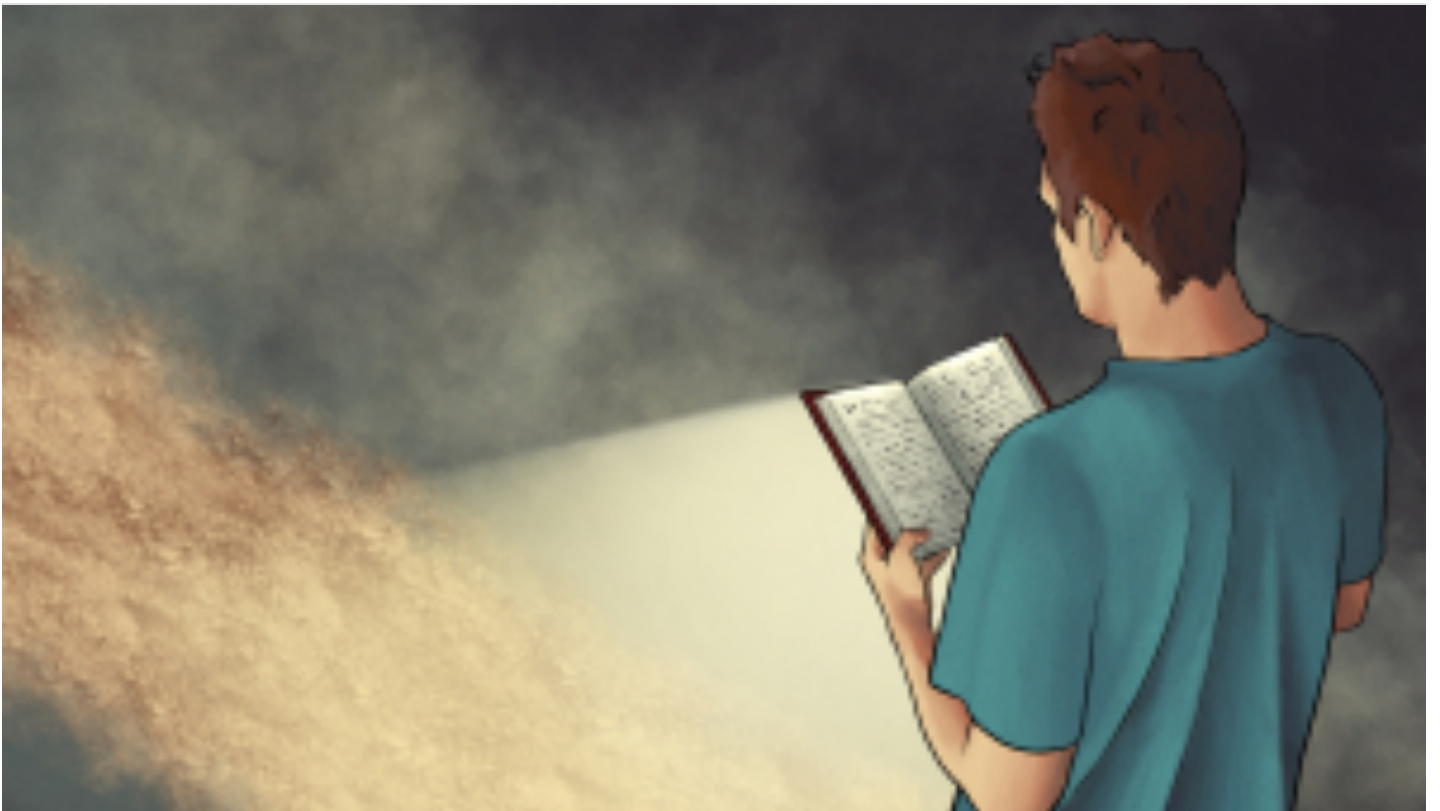
¿Quo Vadis, España? 09/06/2022 - 03:38