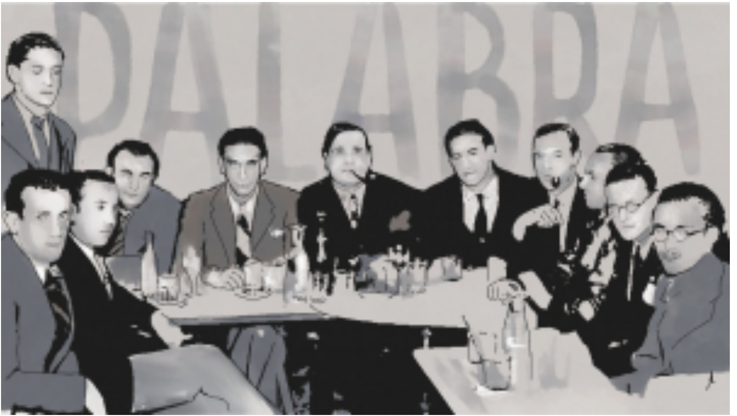
La palabra, ¿es necesaria en nuestra sociedad? 14/05/2022 - 02:03