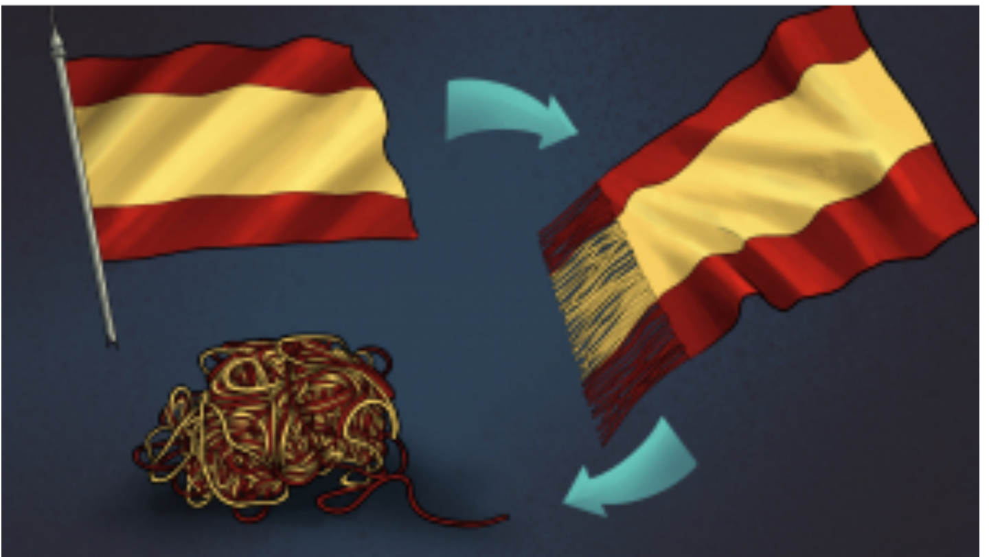
La España apoptótica 05/05/2022 - 02:03