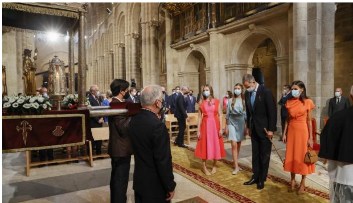
Los reyes Felipe y Letizia, la princesa Leonor (c) y la infanta Sofía (3d) saludan a su llegada a la ofrenda al apóstol Santiago

Pero uno de los aspectos más importantes del camino de Santiago es la vertebración de España, ya desde la Edad Media y la romanización con el cambio de la Hispania visigótica a la Hispania romana. Los ritos cambian, el Camino permanece.