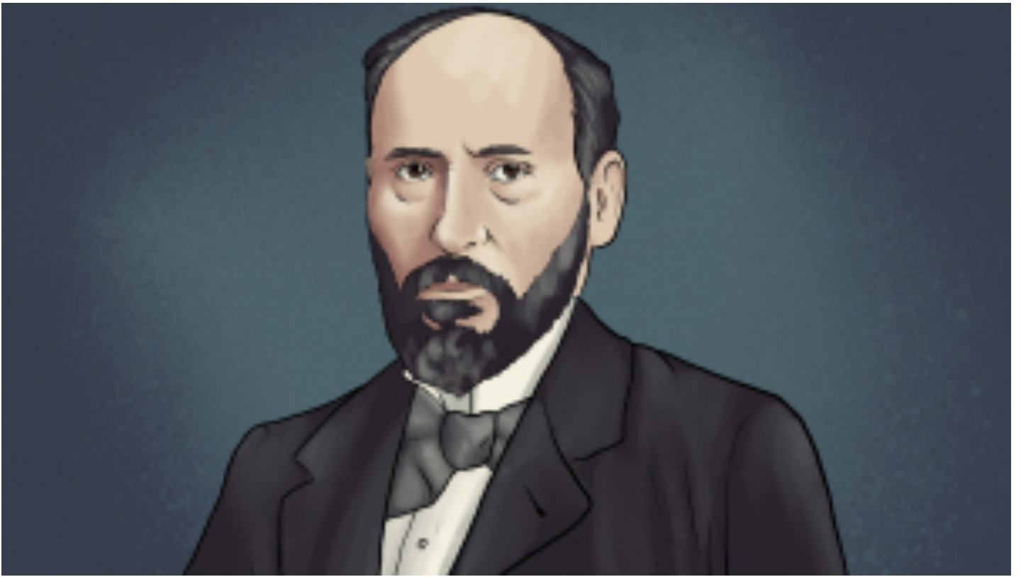
El tesón, esfuerzo y voluntad en Santiago Ramón y Cajal 23/06/2022 - 01:57